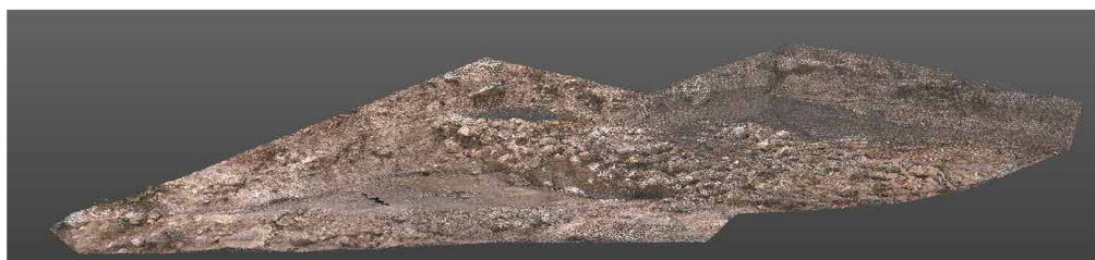
Nuvola di punti area alfa Case Bastione